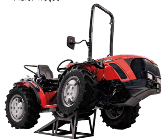
Estrutura do Antonio Carraro