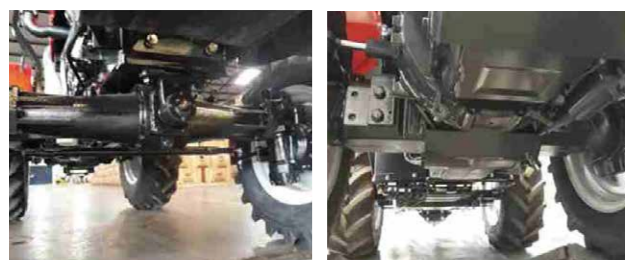
Estrutura do Trator Tradicional

Estrutura que Proporciona mais Estabilidade e Segurança em Operações com Terrenos Acidentados